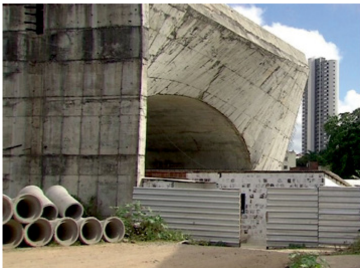
Maioria das obras paradas são ligadas a infraestrutura

A maioria das obras paradas são ligadas à infraestrutura, mas incluem creches, escolas, postos de saúde e outros tipos de construção. As razões para as paralisações vão desde abandono de empresa a questões ambientais, disputas jurídicas e falta de recursos, embora a maior parte diga respeito a