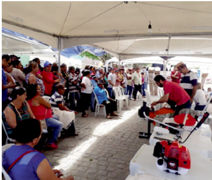
Benefício chega a estabelecimentos familiares

Em todo o Estado, cerca de 275 mil estabelecimentos familiares são responsáveis pela produção de mandioca, feijão, milho, floricultura e hortifrúti, e a distribuição dos kits visa otimizar o trabalho de agricultores, estruturando a produção de alimentos e forragem animal. O caráter produtivo faz parte do Programa Segunda Água e é financiado com recur-