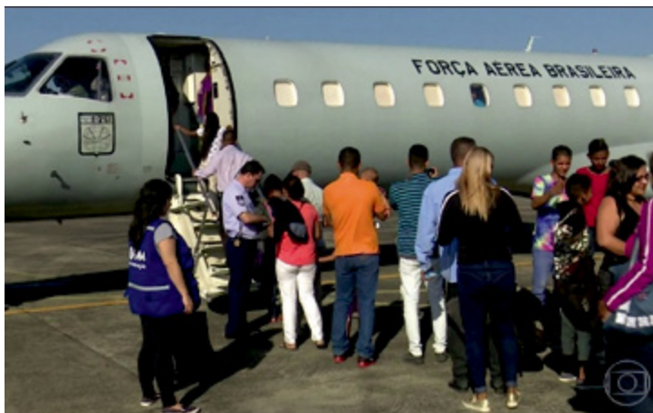
O grupo chegou ao destino com garantia de emprego

■ Um grupo de 30 venezuelanos que solicitou refúgio e residência temporária no Brasil foi levado, no final de outubro, de Boa Vista (RR) a Salvador (BA). De acordo com autoridades brasileiras,