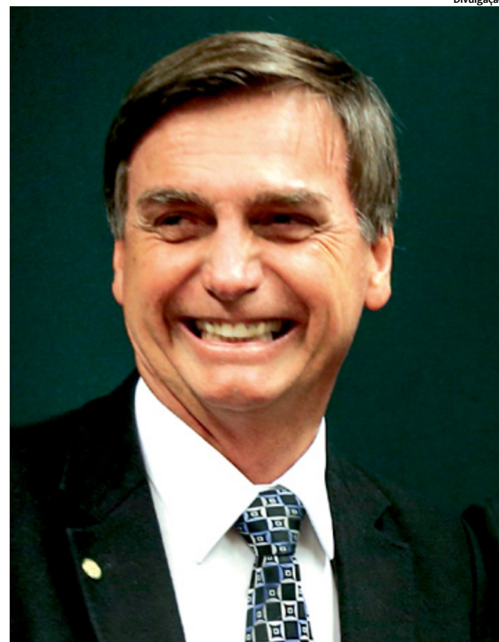
Pesselista superou adversário com 55% dos votos válidos