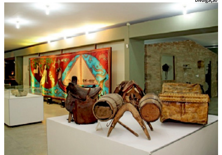
São mais de 3 mil peças distribuídas em diversas alas