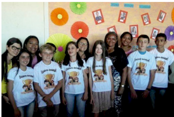
Seis alunos do 9º ano foram destaque na OBA