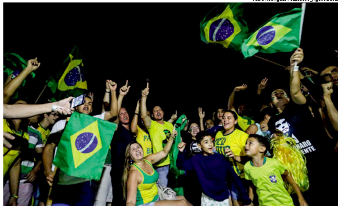
O verde e amarelo tomou conta das manifestações em prol da mudança

com trabalho e determinação, ele conquistou a confiança e simpatia do potencial eleitorado brasileiro que viu nele a possibilidade da tão almejada mudança. Com espaços publicitários de campanha insignificantes na grande mídia oficial, sem apoio e sem dinheiro para investir, o candidato recorreu às mídias alternativas e conquistou adeptos nas redes sociais, que se tornaram seus cabos eleitorais gratuitos. Essa adesão voluntária ganhou adeptos que se multiplicou numa equação geométrica. Eleito com 55% dos votos válidos, contra 45% dos votos do seu adversário Fernando Haddad, saiu vitorioso superando seu adversário com 10 milhões de votos. Em Pernambuco Jair Bolsonaro conquistou 33,5% do eleitorado, mostrando