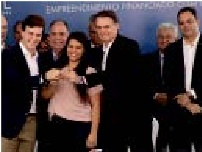
Em Petrolina, Presidente entregou empreendimento

Em coletiva de imprensa, Bolsonaro garantiu que grandes investimentos já estão programados para a região, sendo parte deles destinados para Petrolina e o restante para o Vale do São Francisco, através de linhas de crédito da Caixa Econômica Federal (CEF), sendo destinados para fruticultura e obras. "Em relação à parte local, a Caixa está lançando uma linha de R$ 500 milhões em toda essa região do São Francisco", informou o presidente da CEF,