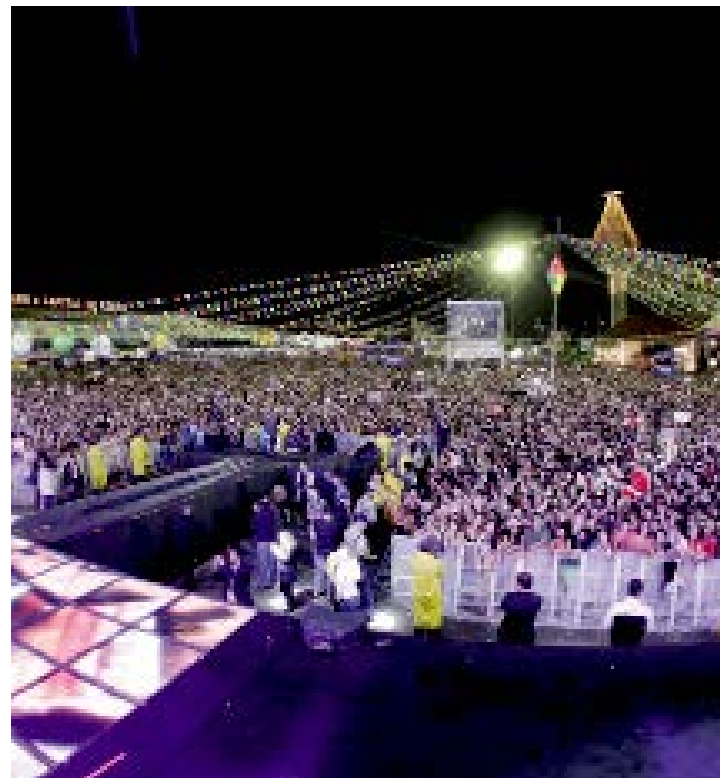
Mais de 500 atrações devem passar pelos Polos descentralizados

• Junho mal começou e Caruaru já deu início às suas comemorações de São João. Ao todo, são 24 polos, com atrações para todos os gostos por quase dois meses. O ciclo junino segue até o dia 14 de julho, com atrações que vão desde o forró pé de serra, à música eletrônica. Para 2019, a prefeitura continua com a propostas dos anos anteriores, fazendo um São João descentralizado, contemplando vários bairros do município com mais de 500 apresentações culturais. A novidade fica por conta do Polo Monte Bom Jesus, que terá programação junina pela primeira vez, recebendo apresentações com o mais autêntico e tradicional forró. Nos demais polos, grandes nomes como Elba Ramalho, DJ Alok, Bruno e Marrone, Marília Mendonça, Petrucio Amorim, Léo Santana, Zé Neto e Cristiano, sobem aos palcos e prometem esquentar as noites caruaruenses. Para esse ano, a prefeitura espera superar os números de 2018, onde a cidade recebeu mais de 2 mi-