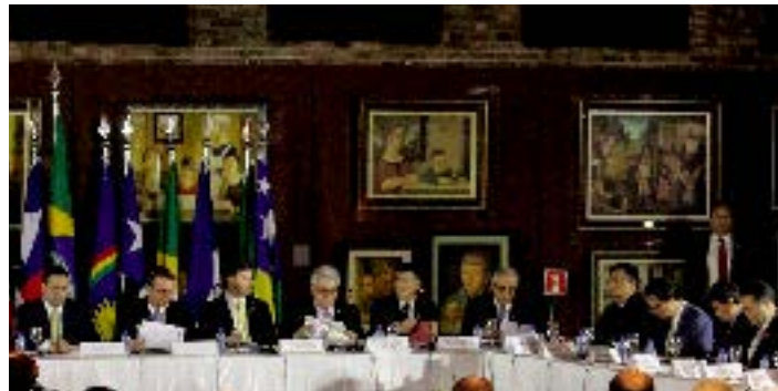
Reunião na Sudene contou com a presença de dez chefes de Estado

Jair Bolsonaro aproveitou a sua visita para pedir apoio à re-