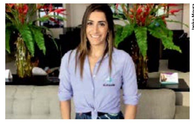
Um click exclusivo da ginasta Daniele Hypólito em recente visita ao Vale do São Francisco.