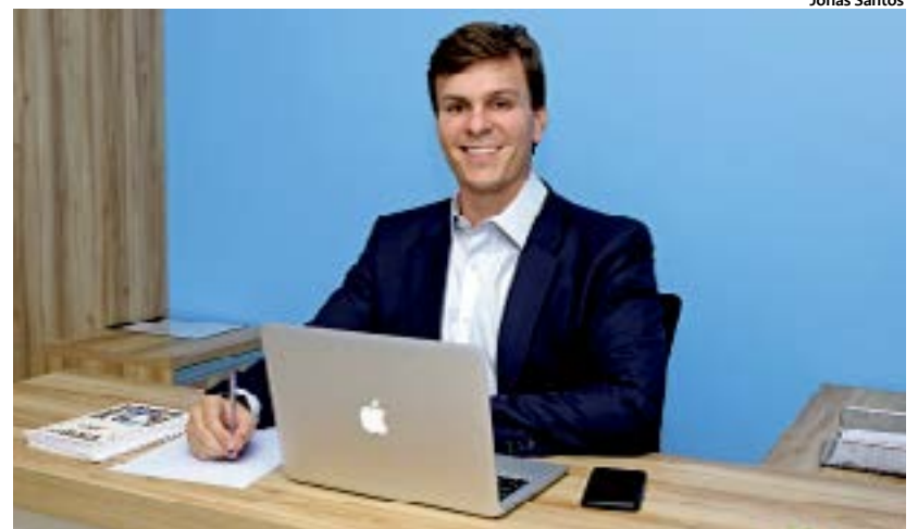
Prefeito integra tradicional família política do Estado

Filho de uma das mais tradicionais famílias políticas do estado, Miguel Coelho entrou cedo na vida parlamentar. Em 2014, aos 23 anos, conseguiu o feito de se tornar o parlamentar mais jovem da Assembleia Legislativa de Pernambuco. E em 2017 faria pela primeira vez a campanha que o levou à cadeira do chefe do Executivo. Bem avaliado pela população, Miguel segue a receita da família pautando sua vida pública com temas a exemplo da educação, agricultura, economia, segurança hídrica e desenvolvimento regional. Formado em direito empresarial, em São Paulo; e criador de movimentos suprapartidários como a União pelo Nordeste, Miguel Coelho concedeu entrevista ao Jornal do Sertão , que apresentamos a seguir.